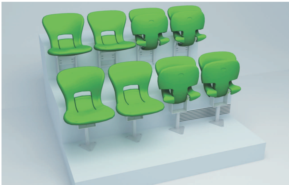
Specifický design s oblými tvary s důrazem na odolnost a ergonomii